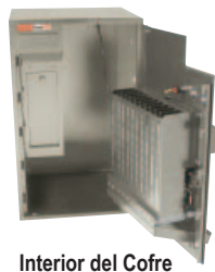
Interior del Cofre