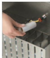
Acercamiento de la Vista de Ensamble del Dispensador