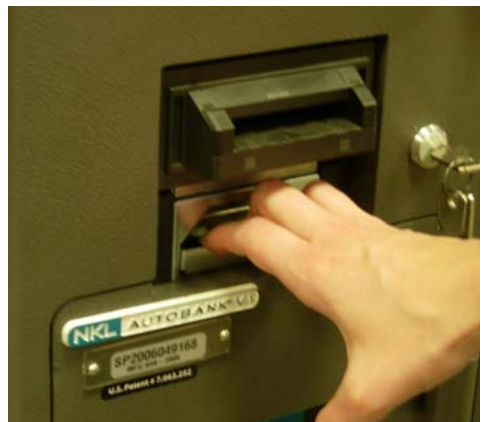
Press down and pull handle