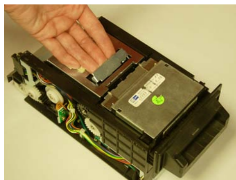
Halle palanca liberada, levante