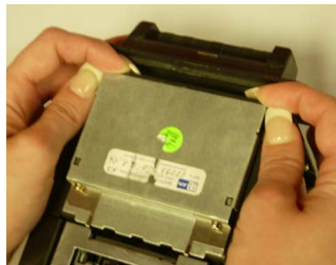
Empuje ganchos hacia delante, Levante