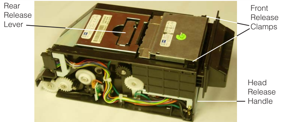
JCM "WBA" Single Feed Validator Head Assembly

Carefully reverse the process of head removal by inserting the head slowly with steady pressure until the connectors mate and the handle lever clicks into place. The stacking mechanism will cycle when the head is fully inserted. Inserting the head too quickly or forcing it can break the electrical connector inside the safe's validator housing where it mates with the rear of the head assembly.