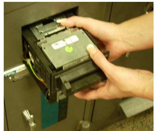
Se resbala sostengala con las dos manos