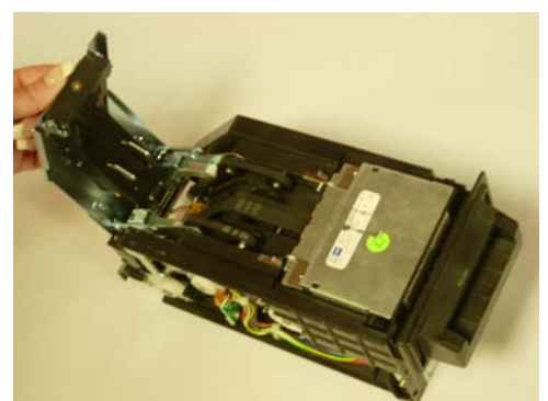
Abra atras el camino del billete