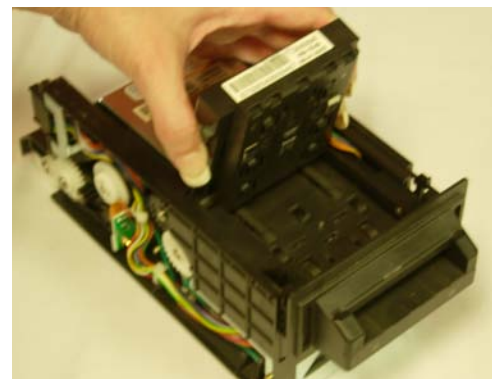
Abra adelante el camino del billete